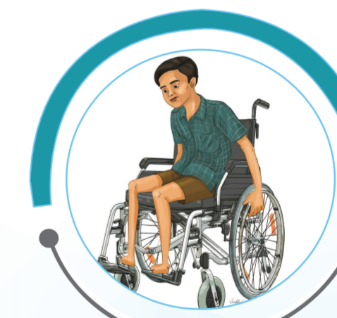
अशक्त/अपाङ्गता भएका व्यक्ति

माथि उल्लेखित ५ प्रकारका घटना दर्ता गर्न दर्ता शिविरमा सहभागी बनौं ।